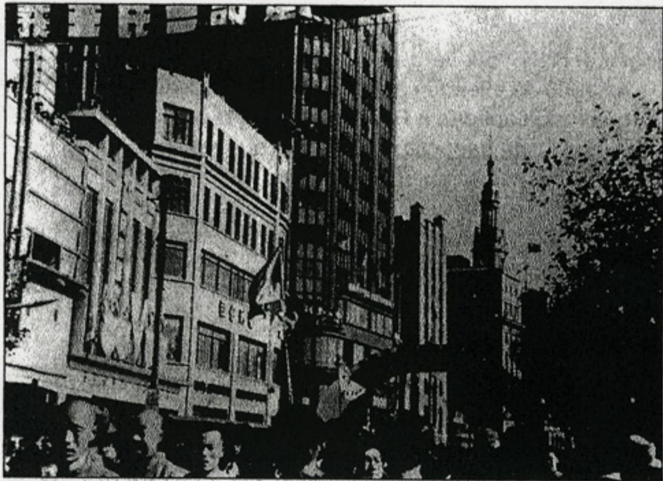
PARK HOTEL, SANGHAJ, 1932