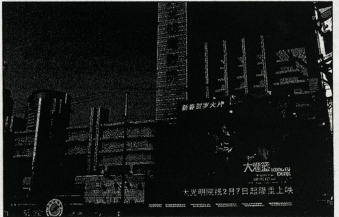
GRAND THEATRE, SANGHAJ, 1934

„Áttekintve alkotásokban gazdag pályafutását, nehezen szabadulunk a sajnálkozás érzésétől, hogy sorsának rendelete folytán ezt a szokatlanul termékeny munkásságú életet nem hazájában tölthette le, s ilyenformán eredményeivel nem