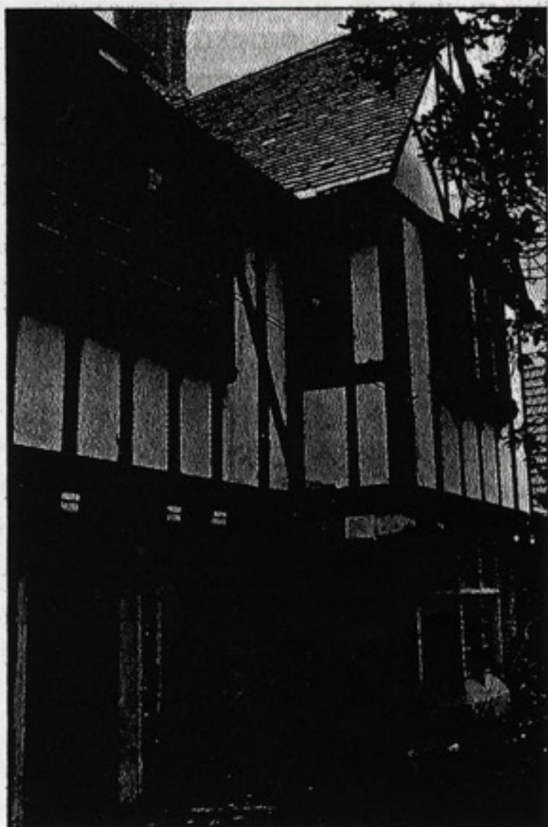
HUDEC CSALÁDI HÁZA, SANGHAJ, 1931-35